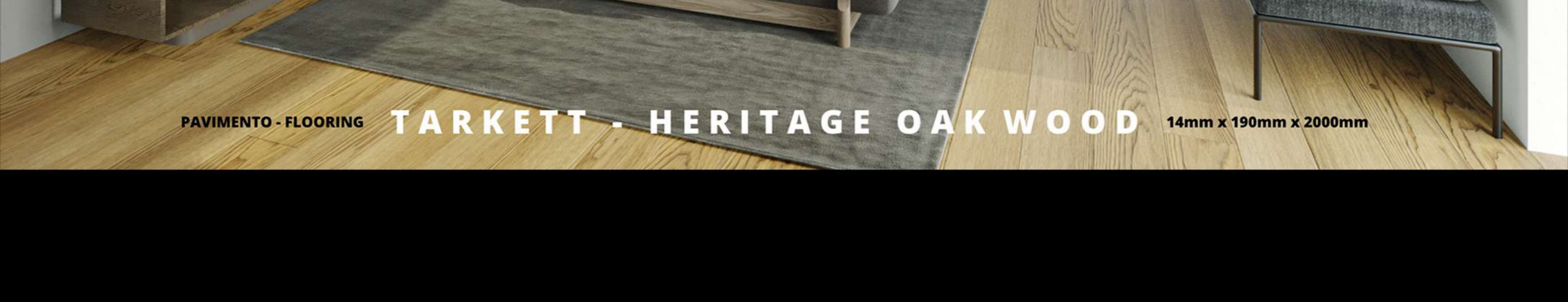
PAVIMENTO - FLOORING TARKETT - HERITAGE OAK WOOD 14mm x 190mm x 2000mm

Wood Flooring, Tarkett 14mm Heritage Oak Wood. Acoustic Blanket 10cm, Sapec Reflex between Streads.